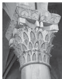
Fig. 18 - Bari, portico del castello. Colonna con capitello realizzato da Ismael

l'abaco di uno dei capitelli di raffinata fattura (Fig. 15 e 16), in prossimità degli altri scolpiti da Melis de Stigliano (o Melo, Melisario ) (Fig. 17) e da Ismael (Fig. 18), e ancora un altro capitello realizzato nell'androne dell'ingresso della cortina ovest del castello di Gioia del Colle (Fig. 19 e 20). Il castello di Bari, fra il 1233 e il 1240, fu oggetto di restauro da parte di Federico II di Svevia e risalgono a questa fase la loggetta affacciata sul cortile, con grossi capitelli firmati appunto da Minerrus da Canosa, Melis da Stigliano e Ismael . Il capitello di Minerrus de Canusia ha proporzioni massicce e s'innesta al fusto della colonna con un collarino, che pre-