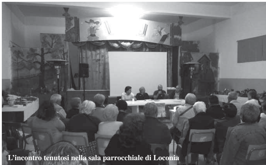
L'incontro tenutosi nella sala parrocchiale di Loconia