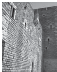
Fig. 19 - Gioia del Colle. Castello, ingresso