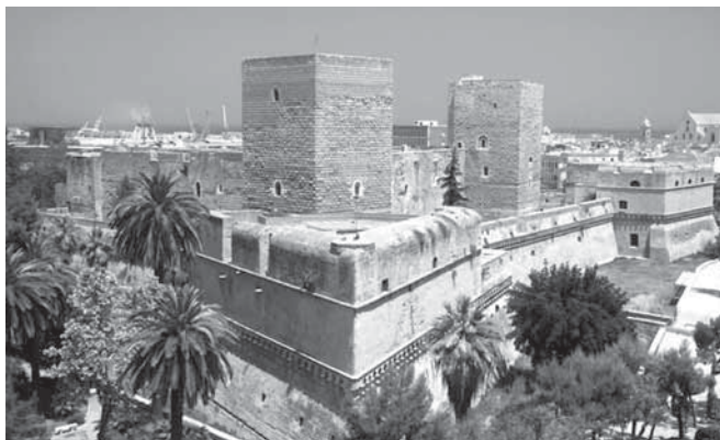
Fig. 1 - Bari. Castello svevo

Il Corriere delle Puglie , di venerdì 27 marzo 1903, pubblicava uno strano ed emozionante articolo dal titolo: “Una preziosa scoperta alla Caserma dei Carabinieri nel Castello di Bari”, riportato anche dalla Tribuna di Roma e dal Figaro di Bari .