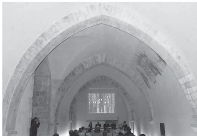
Fig. 3 - Bari, castello svevo. Dipinto sulla parete in alto a destra

Si parlò di un brigadiere dei Carabinieri al quale, mentre dormiva nella stanza del corpo di guardia, apparve per ben tre volte la Vergine Maria che gli ordinò: “di levarle il velo dal volto, che lo ricopriva da tanti anni”. All'alba, il brigadiere avrebbe posto in ese-