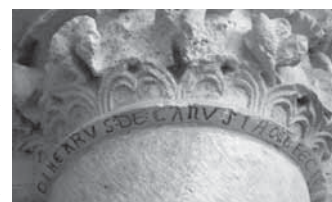
Fig. 21 - Bari, portico del castello. Collarino del capitello realizzato da Minerrus di Canosa, con inciso il suo nome

senta due facce formanti un angolo acuto. Sulla faccia inferiore vi è incisa la scritta: MINERRUS DE CANUSIA HOC OPUS, ME FECIT e, sopra, ripete il motivo dell'aquila imperiale che, ad ali spiegate, stringe trionfante la preda tra i suoi artigli, con evidenti riferimenti allegorici (Fig. 21). Segni forti del potere che, con la loro simbologia, valorizzano l'aspetto delle sculture, soprattutto grazie alle eleganti botteghe di lapicidi anche canosini che le realizzarono, per essere stati questi, con le loro scuole, tra i più competenti specialisti della tecnica e della perfezione artistica di quel periodo.