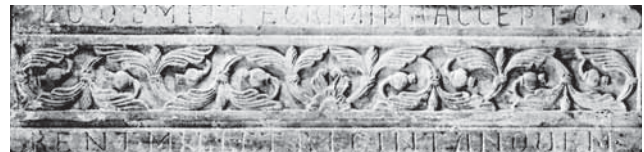
Fig. 7 - Siponto, Cattedrale di S.ta Maria. Trave con l'epigrafe: LO D DMITTE CRIMINA ACCEPTO / RENT MILLE TRIGINTA NOVEM.