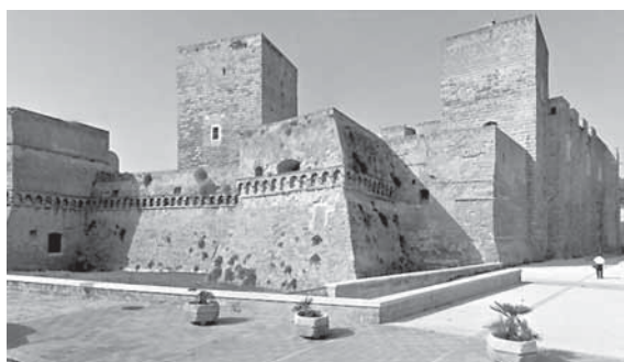
Fig. 12 - Bari, castello

Altra eccellenza canosina è rappresentata da uno scultore del quale, anche di lui, si è quasi persa la memoria pur avendo scolpito magnifici capitelli nei castelli di Bari (Fig. 12) e di Gioia del Colle