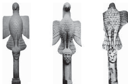
Fig. 3 - Canosa Fig. 4 - Montesantangelo Fig. 5 - Siponto

La "lavorazione della pietra" a Canosa affonda le radici sin nell'antichità ed è dimostrato diffusamente da ciò che rimane dei resti archeologici della città, superstiti e mute testimonianze della grandezza e del suo splendore, tanto da far esclamare all'abate Damadeno, nella spiegazione della famosa Tavola Bronzea: " Canusium fuit, et quod fuerit, sola memoria celebratur; Canusium fuit, et quod fuerit, ingentia ruinarum demonstrant ", per la memoria e le rovine imponenti di edifici, di statue mute, di iscrizioni e di monumenti realizzati durante i secoli dalle numerose maestranze, sotto l'attenta direzione di magistri e protomagistri canosini, rimasti però ignoti. Migliore fortuna ebbero, invece, alcuni scultori medievali che, avvalorando la perdurante tradizione artistica costruttiva e ornamentale "autoctona", hanno lasciato il segno indelebile della loro abilità, con una produzione che si colloca degnamente tra quelle rinomate della splendida fioritura edilizia ed artistica, dall'XI al XIV secolo, inserita nella corrente definita convenzionalmente: "Romanico pugliese". Si allude, soprattutto, al noto arcidiacono Acceptus , il maestro scultore a capo di una squa-