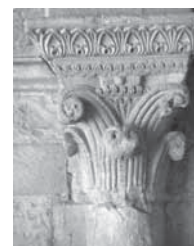
Fig. 20 - Gioia del Colle. Capitello di Minerrus di Canosa.

senta due facce formanti un angolo acuto. Sulla faccia inferiore vi è incisa la scritta: MINERRUS DE CANUSIA HOC OPUS, ME FECIT e, sopra, ripete il motivo dell'aquila imperiale che, ad ali spiegate, stringe trionfante la preda tra i suoi artigli, con evidenti riferimenti allegorici (Fig. 21). Segni forti del potere che, con la loro simbologia, valorizzano l'aspetto delle sculture, soprattutto grazie alle eleganti botteghe di lapicidi anche canosini che le realizzarono, per essere stati questi, con le loro scuole, tra i più competenti specialisti della tecnica e della perfezione artistica di quel periodo.