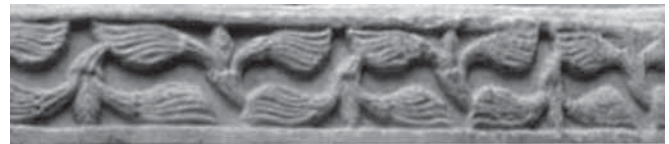
Fig. 8 - Bari, Cattedrale di San Sabino. Stipte dei portali con palmette