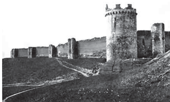
Fig. 11 - Lucera, castello