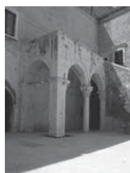
Fig. 14 - Bari, portico del castello. Colonne con capitelli di Minerrus, di Canosa, Melis de Stigliano e Ismael

Il nome di questo lapicida è Minerrus de Canusia (o: Finarrus, Finarro, Finazzo ), di origine araba e forse di razza berbera, cioè musulmano convertito al Cristianesimo, che nella loggetta affacciata al cortile del castello di Bari (Fig. 13 e 14) realizzò e firmò