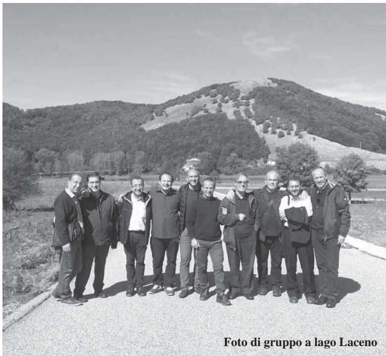
Foto di gruppo a lago Laceno