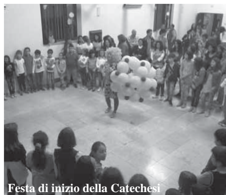
Festa di inizio della Catechesi

ranza di loro il desiderio di sapere, conoscere, imparare per formarsi come uomini e donne di domani. Sono loro il nostro futuro, sono loro la nostra speranza, quella che molto spesso Papa Francesco ci ricorda di non lasciarci rubare. A noi adulti, educatori, a voi genitori è affidata questa missione. C'è tanta sete di Dio nella società in cui viviamo e se noi non ci dissetiamo alle sorgenti della Grazia (la celebrazione Eucaristica domenicale, i sacramenti, la preghiera personale e comunitaria, le opere di carità verso i fratelli bisognosi...) resteremo sempre assetati, correndo il rischio di bere acqua inquinata: quella del male. Solo se ci disseteremo di Dio, potremo dare Dio ai nostri ragazzi e giovani. Diceva san Giovanni Paolo II: “Nessuno può dare ad un altro quello che non ha”. Io aggiungo: “a buon intenditore poche parole...”