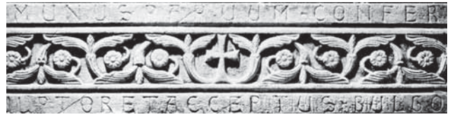
Fig. 6 - Montesantangelo, Santuario di S. Michele. Trave con l'epigrafe: C MUNUS PARVUM CONFER / ULPTOR ET ACCEPTUS BULGO