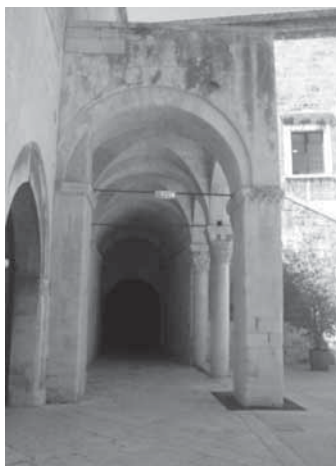
Fig. 2 - Bari. Porticato della loggia interna del castello svevo

Accorso il Colonnello della caserma, si provvide delicatamente a scrostare il resto della parete e, con sommo stupore, si presentò agli occhi degli astanti un affresco raffigurante la Madonna di Costantinopoli, San Sabino e San Nicola , i Patroni della città di Bari.