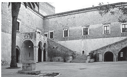
Fig. 13 - Bari, loggia del castello