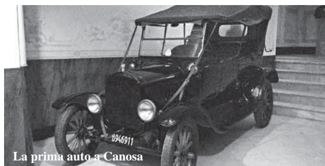
La prima auto a Canosa

Gli orari di visita al Museo, sono tutte le mattine dal martedì al sabato, ore 9.30-12.00 e domenica sera dalle 19.30 alle 22.30 . Giorno di chiusura, il lunedì.