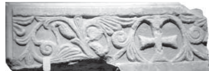
Fig. 9 - Trani, Museo diocesano. Frammento con croce al centro e palmette