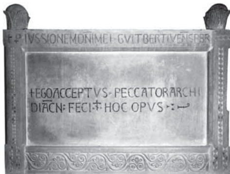
Fig. 2 - Ambone, opera di Acceptus. Fianco destro della cassa con il nome dell'autore

Delle sue creazioni è pervenuta a noi integra l'opera più nota,