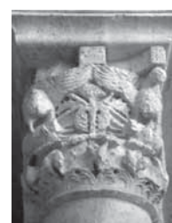
Fig. 15, 16 - Bari, portico del castello. Colonna con capitello realizzato da Minerrus di Canosa