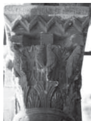
Fig. 17 - Bari, portico del castello. Colonna con capitello realizzato da Melis de Stigliano