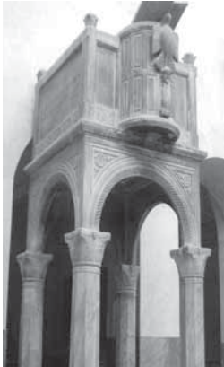
Fig. 1 - Canosa, Cattedrale. Ambone, opera di Acceptus

La "lavorazione della pietra" a Canosa affonda le radici sin nell'antichità ed è dimostrato diffusamente da ciò che rimane dei resti archeologici della città, superstiti e mute testimonianze della grandezza e del suo splendore, tanto da far esclamare all'abate Damadeno, nella spiegazione della famosa Tavola Bronzea: " Canusium fuit, et quod fuerit, sola memoria celebratur; Canusium fuit, et quod fuerit, ingentia ruinarum demonstrant ", per la memoria e le rovine imponenti di edifici, di statue mute, di iscrizioni e di monumenti realizzati durante i secoli dalle numerose maestranze, sotto l'attenta direzione di magistri e protomagistri canosini, rimasti però ignoti. Migliore fortuna ebbero, invece, alcuni scultori medievali che, avvalorando la perdurante tradizione artistica costruttiva e ornamentale "autoctona", hanno lasciato il segno indelebile della loro abilità, con una produzione che si colloca degnamente tra quelle rinomate della splendida fioritura edilizia ed artistica, dall'XI al XIV secolo, inserita nella corrente definita convenzionalmente: "Romanico pugliese". Si allude, soprattutto, al noto arcidiacono Acceptus , il maestro scultore a capo di una squa-